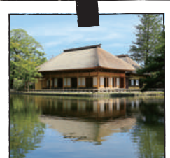
旧有備館および庭園

江戸時代の仙台藩家臣である岩出山伊達家が開設した郷学（学問所）。「旧有備館および庭園」の名称で国の史跡および名勝に指定されている。夏季企画展「近世岩出山の礎を築いた家康と政宗展」開催中。学芸員による解説付きで見学。