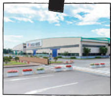
積水ハウス東北工場

楽しく体験・実感できる住まいのテーマパーク。職員の説明で見学し、住まいにとって大切な「安心・安全・快適」のひみつを学ぶ。