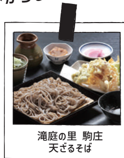
滝庭の里 駒庄 天ざるそば

古民家を再生した店内で加美町産 100% の手打ちそば、山里ならではの地の物にこだわった季節の天ぷらをどうぞ♡