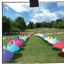
やくらいガーデン

総面積 15 万平方メートル、栽培植物 400 種類からなる広大な庭園。1,000 本を超えるアンブレラが園内を彩る『アンブレラスカイ』開催中！