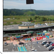
あ・ら・伊達道の駅

グランプリ上位常連の言わずと知れた道の駅。新鮮野菜が並ぶ産直やお土産、東北では唯一のロイズ常設販売コーナーもある。