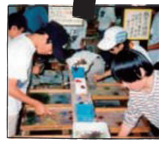
東山和紙 紙すき館

中尊寺を含む平泉の文化遺産として 2011 年世界文化遺産登録。国宝建造物第 1 号の金色堂は中尊寺創建当初の姿を今に伝える唯一の建造物で奥州藤原文化を象徴するもの。観光ガイドの案内で中尊寺境内をめぐる。