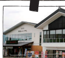
平泉レストハウス

創業 1873 年（明治 6 年）、今年で 150 周年を迎えた湯治文化を伝承する温泉宿。彩り豊か、様々な色に変化する源泉かけ流しの温泉と湯煙が最大の特徴。