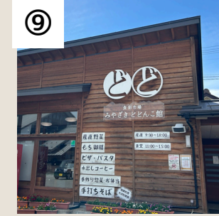
⑨ 食彩市場 みやざき どんこ館

宮崎獅子舞の「どどん」という太鼓の音と「パクッ」と獅子がくわえる音から「どどんこ館」という名称に。地場商品の販売と食事処を併設。