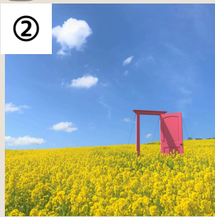
② やくらいガーデン

栽培植物400種類からなる総面積15万平方メートルの広大な庭園。四季を通して花々が豊かに咲き乱れ、冬季のイルミネーションにも人気。