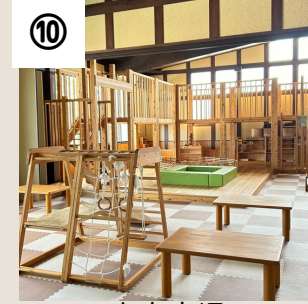
⑩ 木育広場 (加美商工会宮崎支所)

広場内には木製遊具・滑り台などがあり、0歳児から小学校入学前のお子様と親子が気軽に遊べる場所。（授乳室あり） ※休日はお隣どどんこ館で受付を。