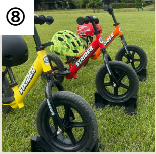
⑧ やくらいランニングバイクパーク

ランニングバイクとはペダルなし自転車のこと。初めてでも芝生コースでバランス感覚を養いながら楽しく乗る事が。（レンタル有）