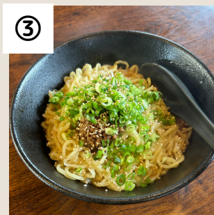
③ 麺屋 斎虎

細麺ストレートの鶏チャーシュー麺が看板メニューです。日により限定メニューあり。僕のおすすめは汁なし担々麺大盛中辛に小ライス。ぜひ食べてみてください。